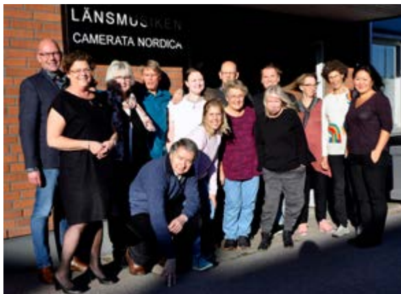
Styrelse och personal på Länsmusiken.