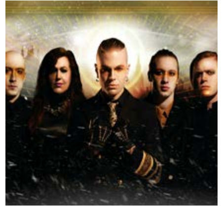
Rave the Requiem

In the UK, conversations continue with a number of key organisations who wish to work with Talentcoach, ranging from festivals such as The Great Escape, creative hubs such as The Rattle in London and a number of regional artist development initiatives