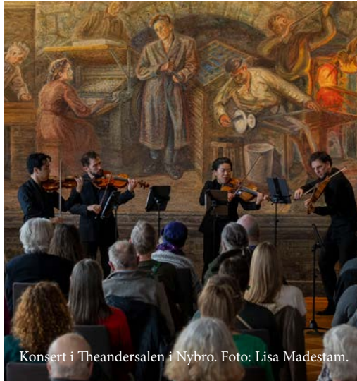
Konsert i Theandersalen i Nybro.