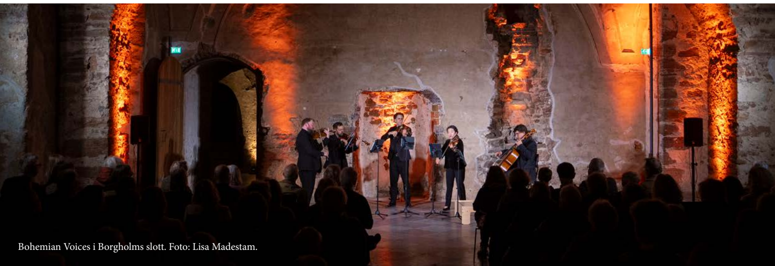
Bohemian Voices i Borgholms slott.