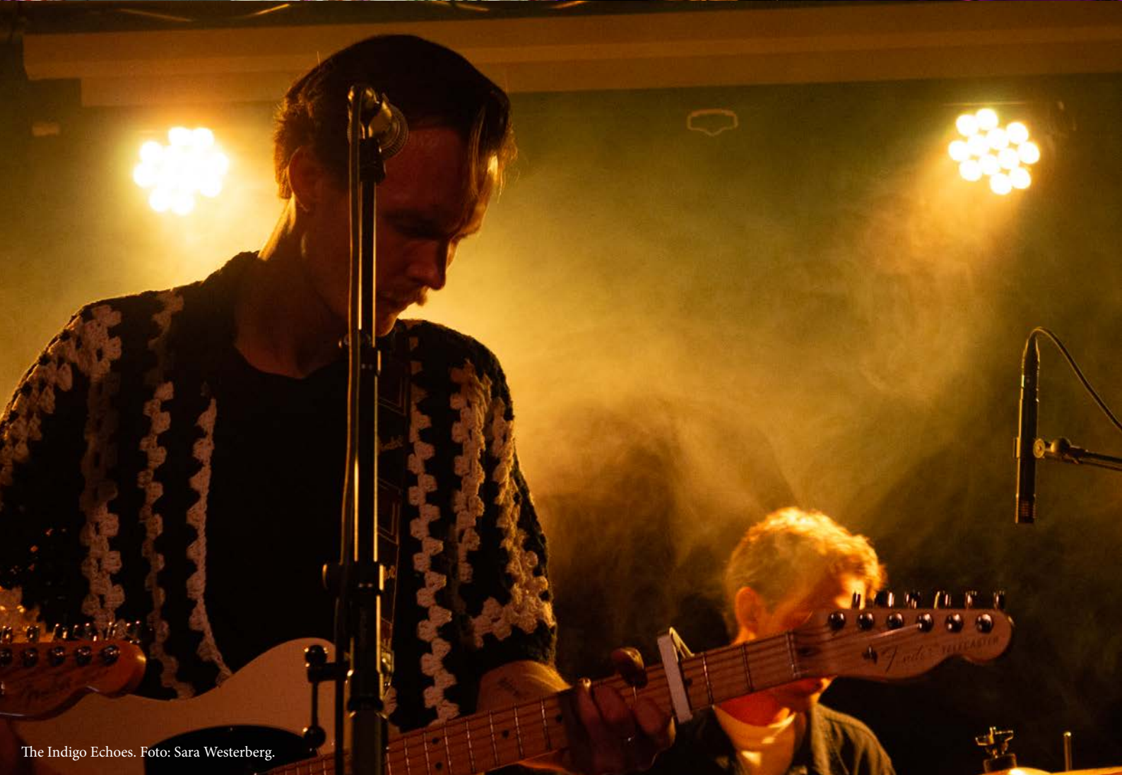
The Indigo Echoes.