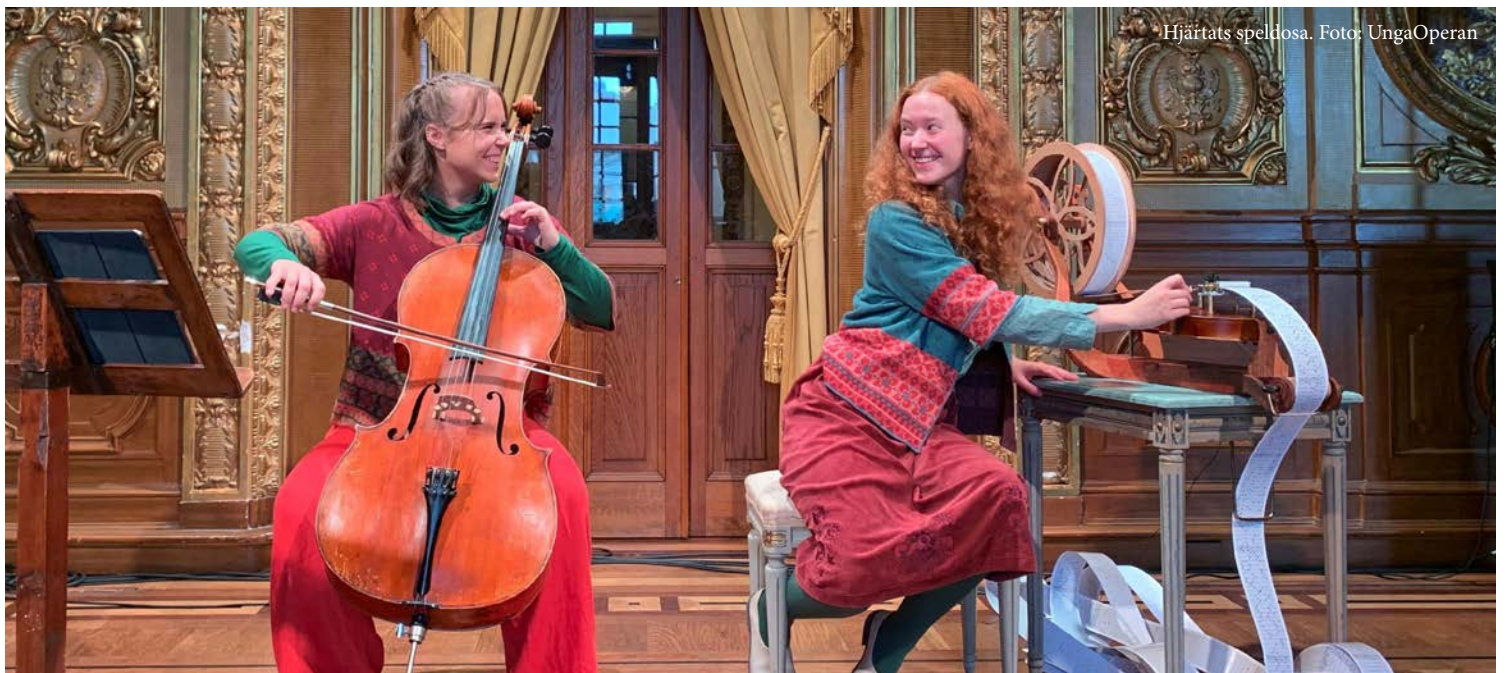
Hjärtats speldosa.