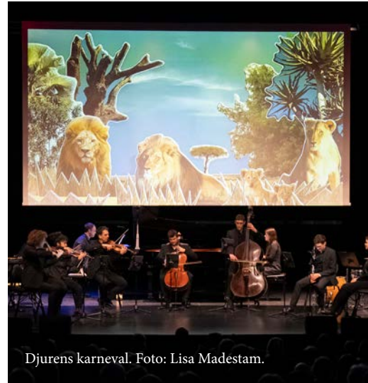
Djurens karneval.