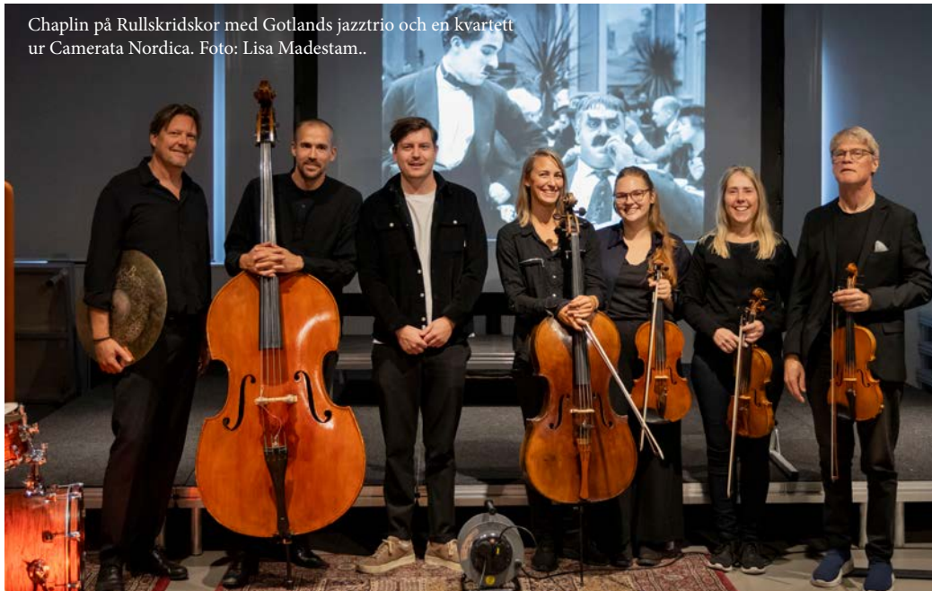
Chaplin på Rullskridskor med Gotlands jazztrio och en kvartett ur Camerata Nordica.