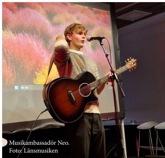
Musikambassadör Neo.