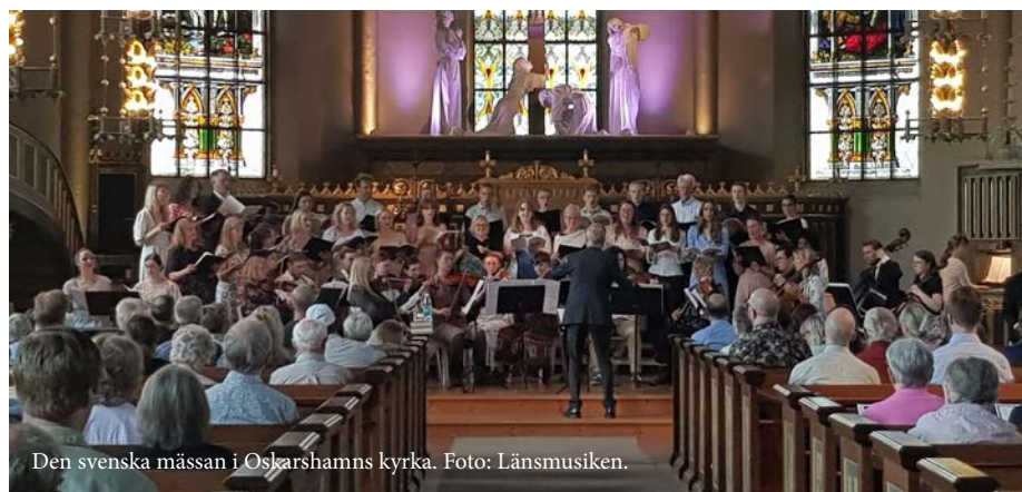
Den svenska mässan i Oskarshamns kyrka.