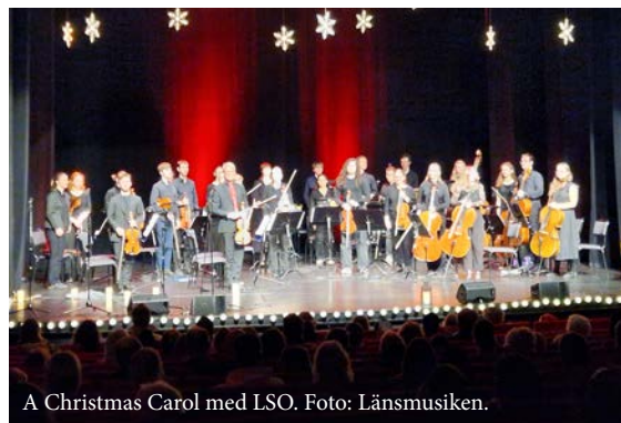
A Christmas Carol med LSO.